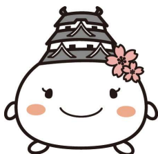
姫路市キャラクター しろまるひめ

外部機関（学校・医療機関・保健所等）と連携し、大きな輪の中で子どもたちの成長できる環境を作ります。